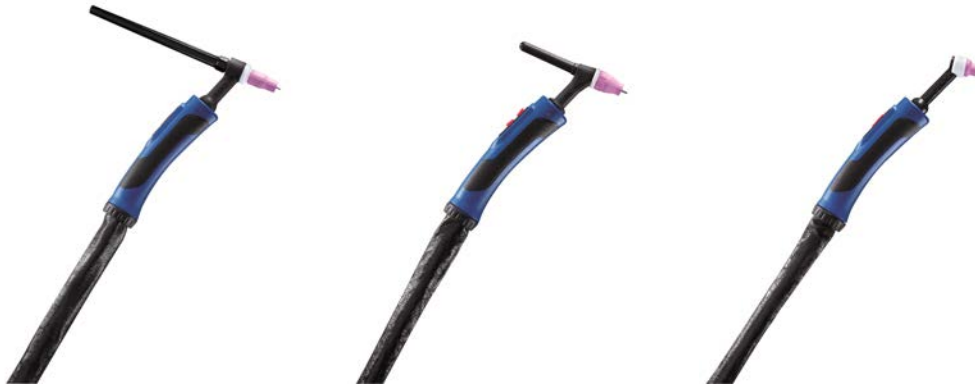
Kuva 2.: ABITIG® GRIP Little -polttimet

TIG -tuoteryhmässä esittelemme mm. ABITIG® GRIP Little –kädensijoilla varustetut TIG-hitsauspolttimet, jotka pienen kokonsa ja keveytensä ansiosta soveltuvat vaikeamminkin hitsattaviin kohteisiin. Polttimien kädensijat voidaan varustaa monipuolisilla kytkin- sekä ohjausmoduuleilla. Kulutusosat ovat yhteensopivia tuttujen SR-polttimiemme kulutusosien kanssa.