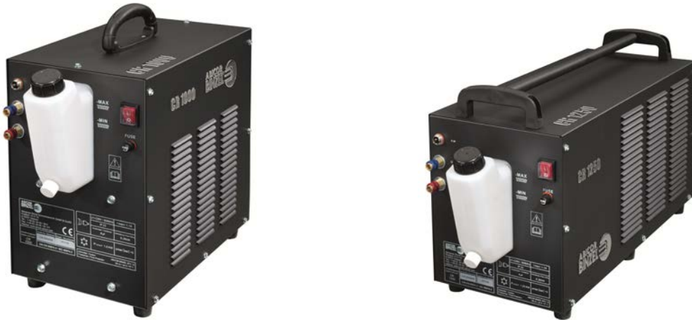
Kuva 4.: Jäähdytyslaitteet CR 1000 ja CR 1250

Osastollamme voit tutustua myös uusiin kannettaviin CR 1000 ja CR 1250 -jäähdytyslaitteisiin, jotka täydentävät ilmajäähdytteiseen hitsaukseen tarkoitetut virtalähteet nestejäähdytteisillä hitsauspolttimilla käytettäviksi. Laitteissa yhdistyvät hyvä jäähdytyskyky, kompakti koko ja helppo käsiteltävyys.