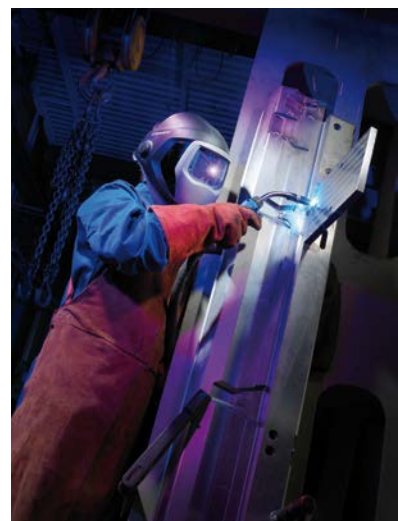
Kuva 1.: ABIMIG® W T -hitsauspoltin