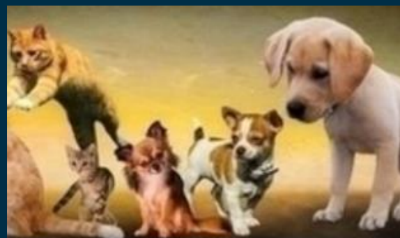
Lemmikki Tampere 19 7.–8.9.2019