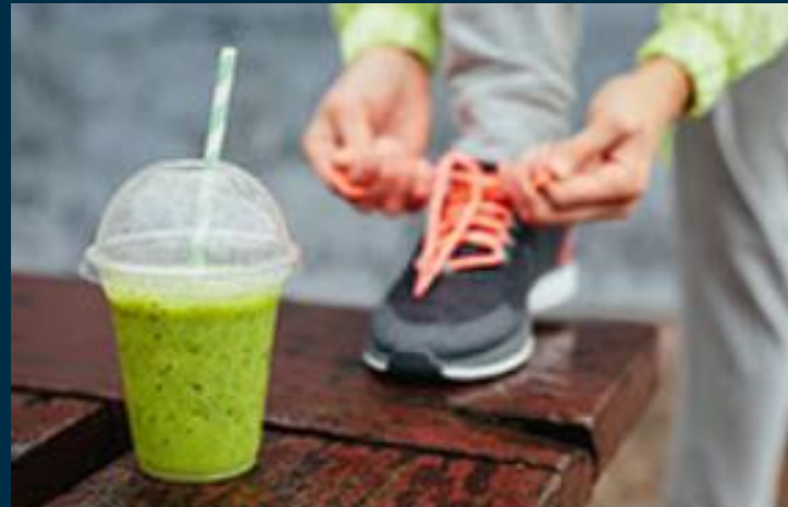
Vire – Tampereen terveysmessut 12.–13.1.2019