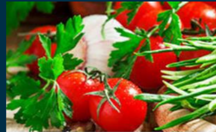
Aittoa & luomua 12.–13.1.2019