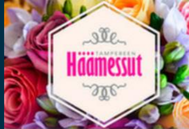
Tampereen Häämessut 9.–10.2.2019